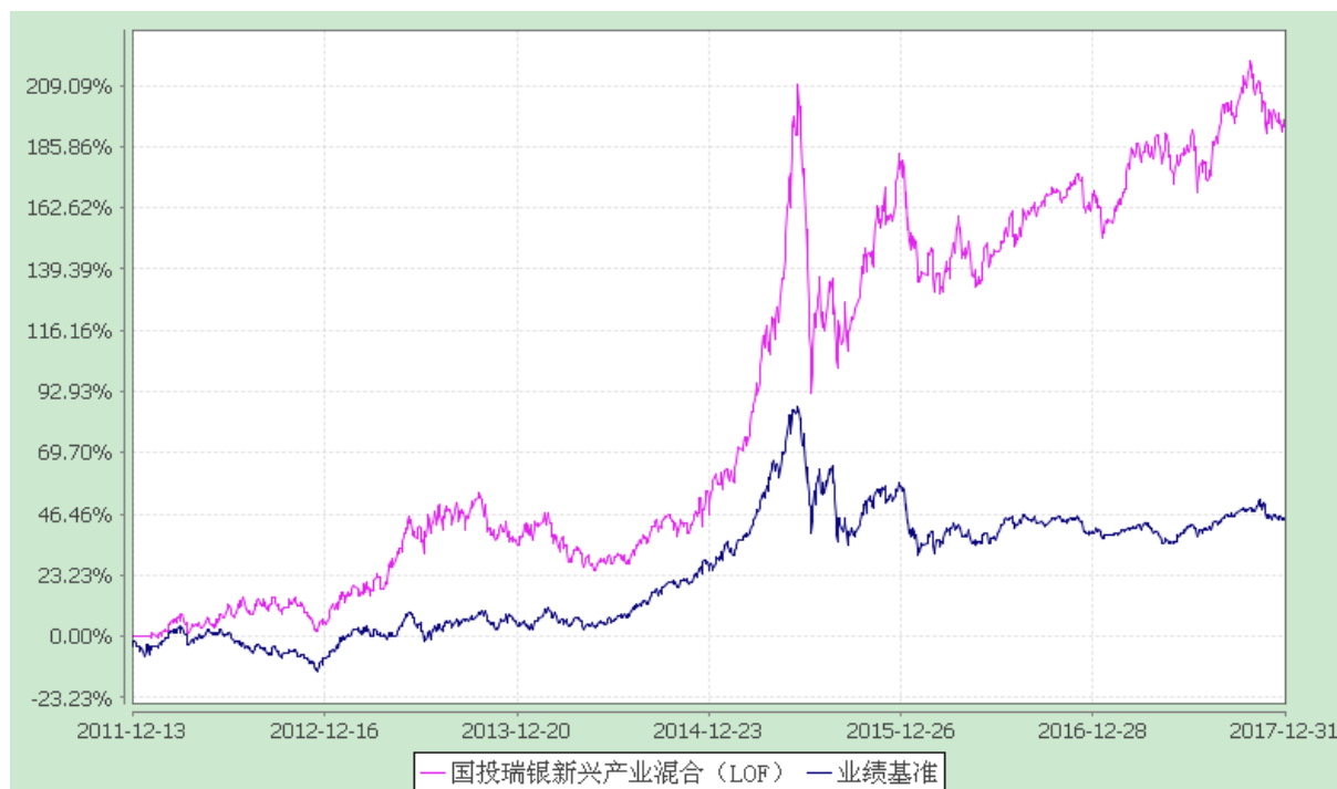
国投瑞银新兴产业混合型证券投资基金(LOF) 份额累计净值增长率与业绩比较基准收益率的历史走势对比图 (2011 年 12 月 13 日至 2017 年 12 月 31 日)

注：本基金建仓期为自基金合同生效日起的 6 个月。截至建仓期结束，本基金各项资产配置比例符合基金合同及招募说明书有关投资比例的约定。