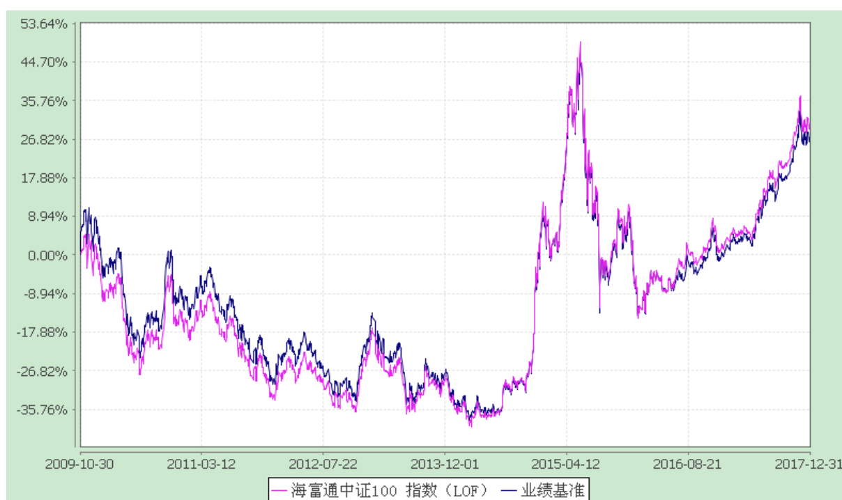
海富通中证 100 指数证券投资基金 (LOF) 份额累计净值增长率与业绩比较基准收益率的历史走势对比图 (2009 年 10 月 30 日至 2017 年 12 月 31 日)

注：按照本基金合同规定，本基金建仓期为基金合同生效之日起六个月。建仓期满至今，本基金投资组合均达到本基金合同第十五条（二）、（七）规定的比例限制及本基金投资组合的比例范围。