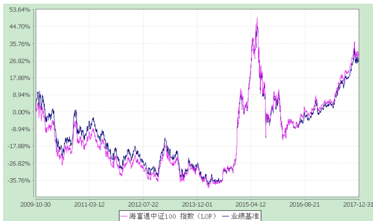
海富通中证 100 指数证券投资基金 (LOF) 份额累计净值增长率与业绩比较基准收益率的历史走势对比图 (2009 年 10 月 30 日至 2017 年 12 月 31 日)

注：按照本基金合同规定，本基金建仓期为基金合同生效之日起六个月。建仓期满至今，本基金投资组合均达到本基金合同第十五条（二）、（七）规定的比例限制及本基金投资组合的比例范围。