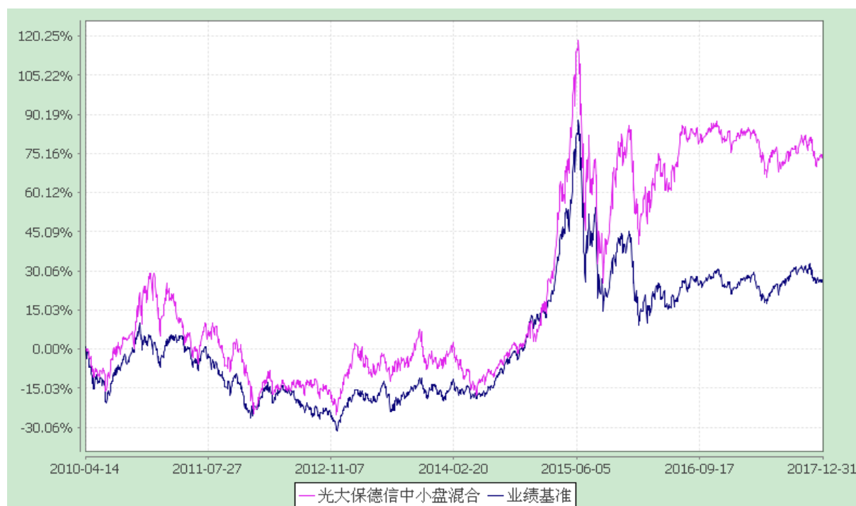
光大保德信中小盘混合型证券投资基金 份额累计净值增长率与业绩比较基准收益率的历史走势对比图 (2010 年 4 月 14 日至 2017 年 12 月 31 日)

注：根据基金合同的规定，本基金建仓期为 2010 年 4 月 14 日至 2010 年 10 月 13 日。建仓期结