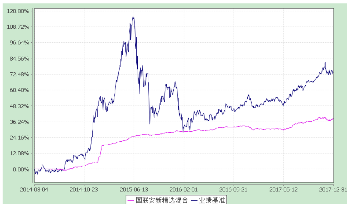
国联安新精选灵活配置混合型证券投资基金 份额累计净值增长率与业绩比较基准收益率的历史走势对比图 (2014 年 3 月 4 日至 2017 年 12 月 31 日)

注：1、本基金业绩比较基准为：沪深 300 指数×85% + 上证国债指数×15%；