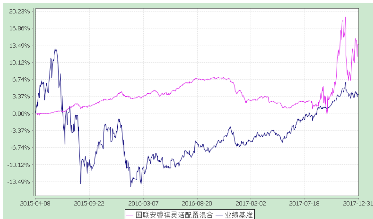
国联安睿祺灵活配置混合型证券投资基金 份额累计净值增长率与业绩比较基准收益率的历史走势对比图 (2015 年 4 月 8 日至 2017 年 12 月 31 日)