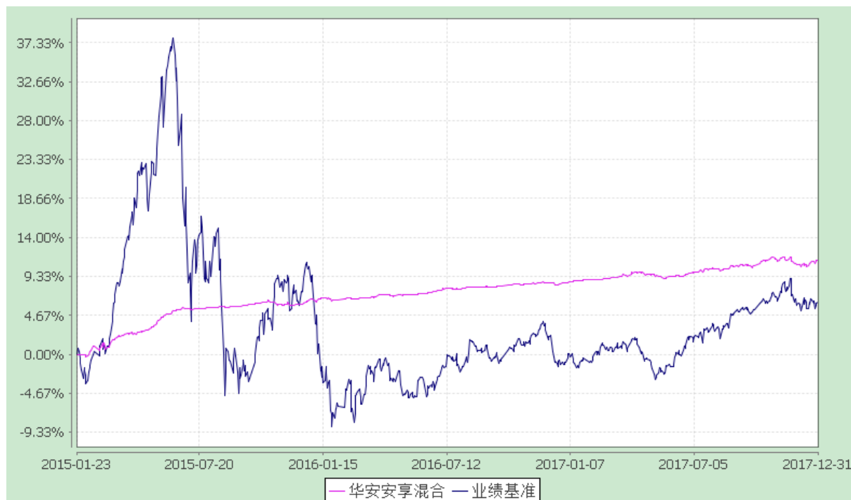
华安安享灵活配置混合型证券投资基金 份额累计净值增长率与业绩比较基准收益率的历史走势对比图 (2015 年 1 月 23 日至 2017 年 12 月 31 日)