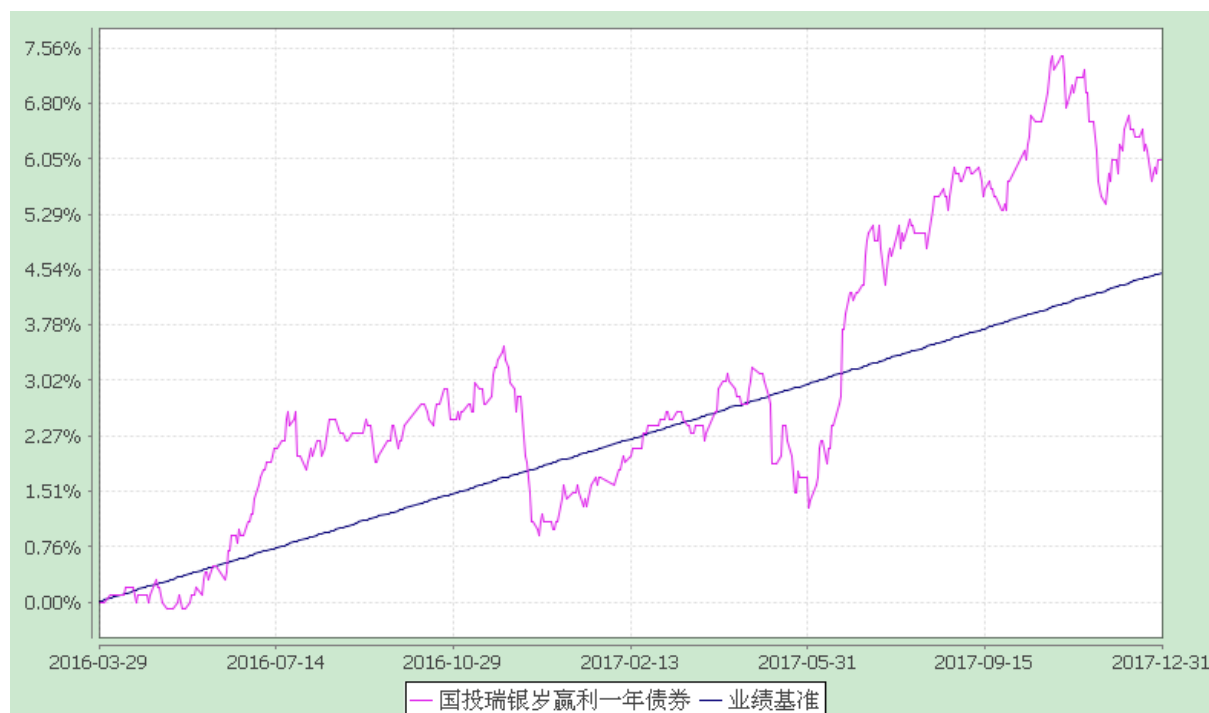
国投瑞银岁赢利一年期定期开放债券型证券投资基金 份额累计净值增长率与业绩比较基准收益率的历史走势对比图 (2016 年 3 月 29 日至 2017 年 12 月 31 日)