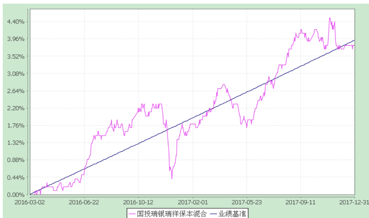
国投瑞银瑞祥保本混合型证券投资基金 份额累计净值增长率与业绩比较基准收益率的历史走势对比图 (2016年3月2日至2017年12月31日)

注：本基金建仓期为自基金合同生效日起的六个月。截至建仓期结束，本基金各项资产配置比例符合基金合同及招募说明书有关投资比例的约定。