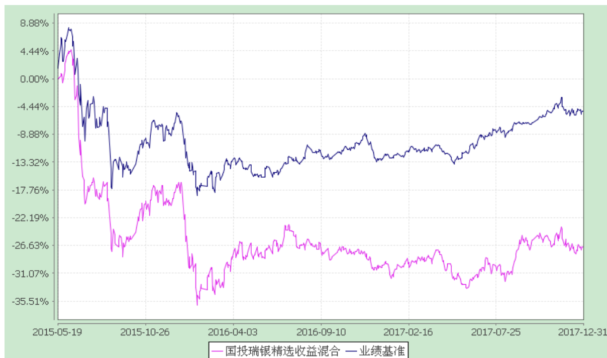
国投瑞银精选收益灵活配置混合型证券投资基金 份额累计净值增长率与业绩比较基准收益率的历史走势对比图 (2015 年 5 月 19 日至 2017 年 12 月 31 日)

注：本基金建仓期为自基金合同生效日起的 6 个月。截至建仓期结束，本基金各项资产配置比例符合基金合同及招募说明书有关投资比例的约定。