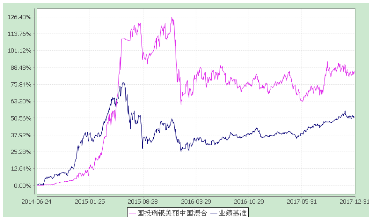
国投瑞银美丽中国灵活配置混合型证券投资基金 份额累计净值增长率与业绩比较基准收益率的历史走势对比图 (2014 年 6 月 24 日至 2017 年 12 月 31 日)