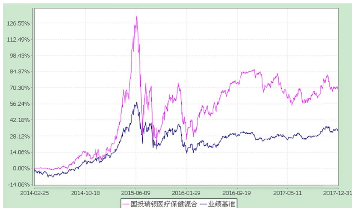
国投瑞银医疗保健行业灵活配置混合型证券投资基金 份额累计净值增长率与业绩比较基准收益率的历史走势对比图 (2014 年 2 月 25 日至 2017 年 12 月 31 日)

注：本基金建仓期为自基金合同生效日起的 6 个月。截至建仓期结束，本基金各项资产配置比例符合基金合同及招募说明书有关投资比例的约定。