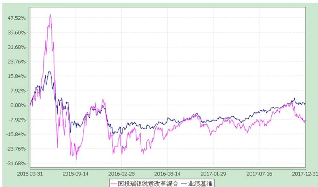
国投瑞银锐意改革灵活配置混合型证券投资基金 份额累计净值增长率与业绩比较基准收益率的历史走势对比图 (2015 年 3 月 31 日至 2017 年 12 月 31 日)

注：本基金建仓期为自基金合同生效日起的六个月。截至本报告期末，本基金各项资产配置比例符合基金合同及招募说明书有关投资比例的约定。