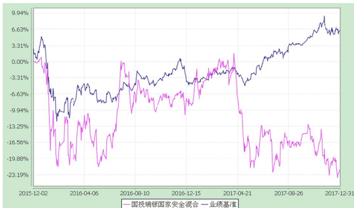
国投瑞银国家安全灵活配置混合型证券投资基金 份额累计净值增长率与业绩比较基准收益率的历史走势对比图 (2015 年 12 月 2 日至 2017 年 12 月 31 日)