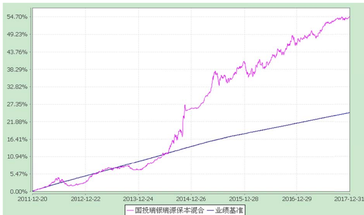
国投瑞银瑞源保本混合型证券投资基金 份额累计净值增长率与业绩比较基准收益率的历史走势对比图 (2011 年 12 月 20 日至 2017 年 12 月 31 日)

注：本基金建仓期为自基金合同生效日起的 6 个月。截至建仓期结束，本基金各项资产配置比例符合基金合同及招募说明书有关投资比例的约定。