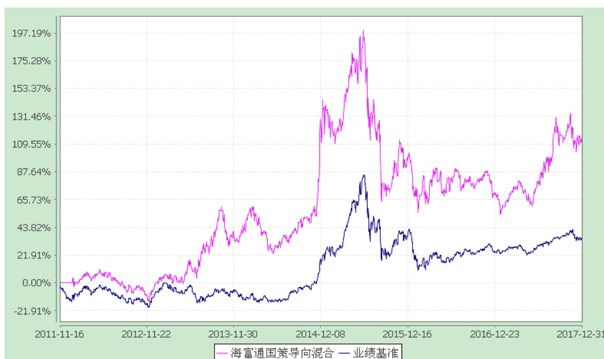
海富通国策导向混合型证券投资基金 份额累计净值增长率与业绩比较基准收益率的历史走势对比图 (2011 年 11 月 16 日至 2017 年 12 月 31 日)

注：按照本基金合同规定，本基金建仓期为基金合同生效之日起六个月。截至报告期末本基金的各项投资比例已达到基金合同第十四部分（二）投资范围、（七）投资限制中规定的各项比例。