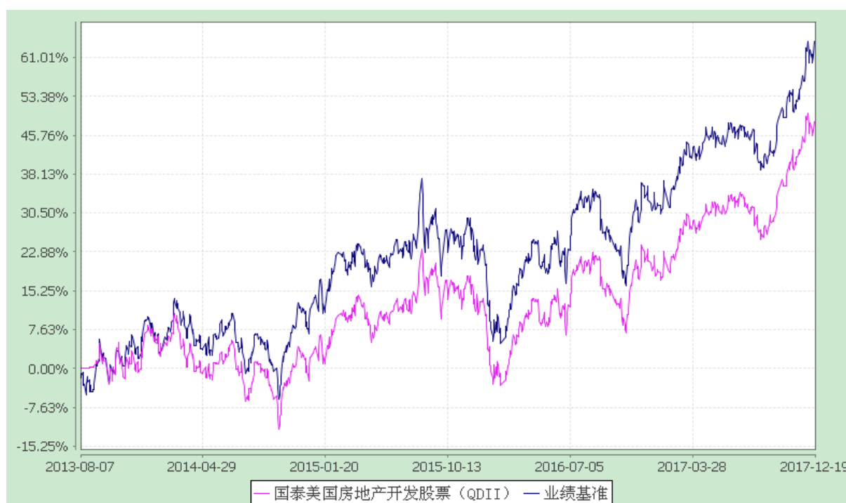
国泰美国房地产开发股票型证券投资基金 自基金合同生效以来份额累计净值增长率与业绩比较基准收益率历史走势对比图 (2013 年 8 月 7 日至 2017 年 12 月 19 日)

注：（1）本基金合同生效日为 2013 年 8 月 7 日，本基金在六个月建仓期结束时，各项资产配置比例符合合同约定；