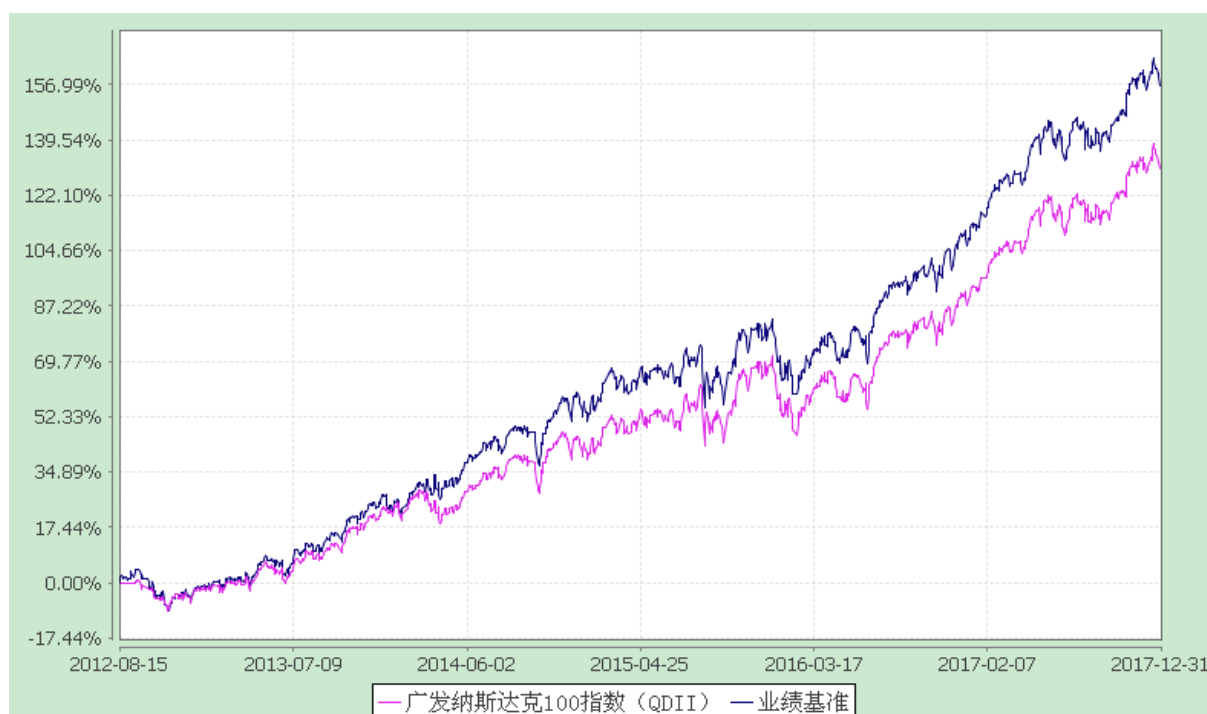
广发纳斯达克 100 指数证券投资基金 份额累计净值增长率与业绩比较基准收益率历史走势对比图 (2012 年 8 月 15 日至 2017 年 12 月 31 日)