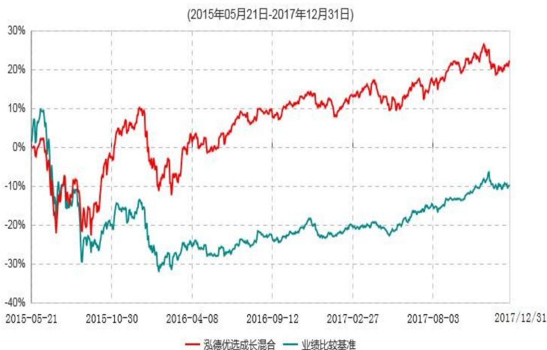
泓德优选成长混合型证券投资基金累计净值增长率与业绩比较基准收益率历史走势对比图

注：根据基金合同的约定，本基金建仓期为6个月，截至报告日，本基金的各项投资比例符合基金合同关于投资范围及投资限制规定。