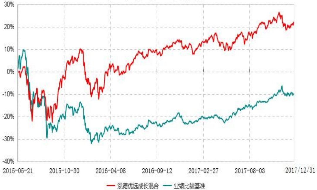
泓德优选成长混合型证券投资基金累计净值增长率与业绩比较基准收益率历史走势对比图 (2015年05月21日-2017年12月31日)

注：根据基金合同的约定，本基金建仓期为6个月，截至报告日，本基金的各项投资比例符合基金合同关于投资范围及投资限制规定。