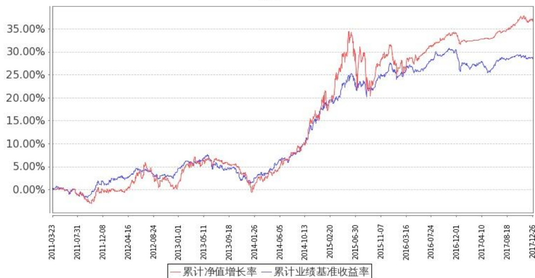
图：嘉实多利分级债券基金份额累计净值增长率与同期业绩比较基准收益率的历史走势对比图 (2011年3月23日至2017年12月31日)

注：按基金合同和招募说明书的约定，本基金自基金合同生效日起6个月内为建仓期，建仓期结束时本基金的各项投资比例符合基金合同（十六（二）投资范围和（五）投资限制2.基金投资组合限制）的有关约定。