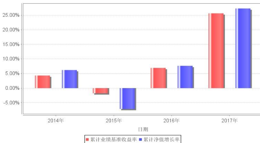
基金每年净值增长率与同期业绩比较基准收益率的对比图