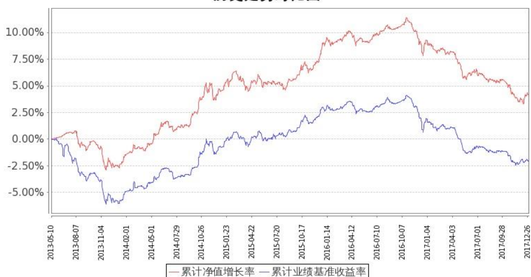
图 2：嘉实中证金边中期国债 ETF 联接 C 基金份额累计净值增长率与同期业绩比较基准收益率的历史走势对比图