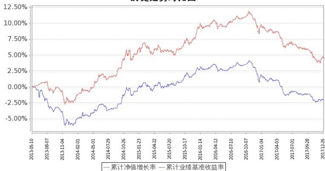
图 1：嘉实中证金边中期国债 ETF 联接 A 基金份额累计净值增长率与同期业绩比较基准收益率的历史走势对比图