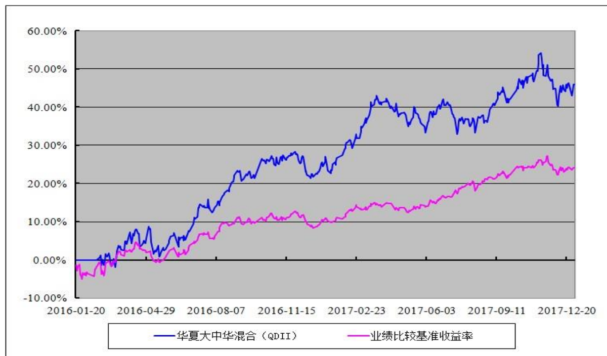
华夏大中华企业精选灵活配置混合型证券投资基金（QDII） 份额累计净值增长率与业绩比较基准收益率历史走势对比图 (2016年1月20日至2017年12月31日)