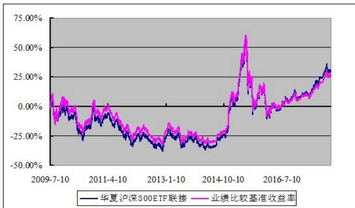
华夏沪深 300 交易型开放式指数证券投资基金联接基金 份额累计净值增长率与业绩比较基准收益率的历史走势对比图 (2009 年 7 月 10 日至 2017 年 12 月 31 日)