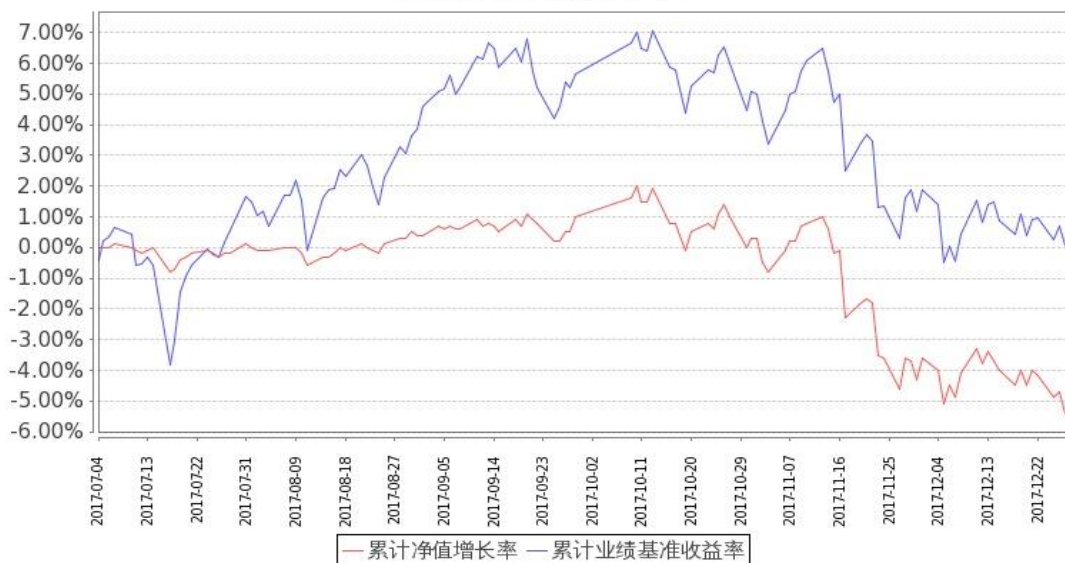
图：嘉实中小企业量化活力灵活配置混合基金份额累计净值增长率与同期业绩比较基准收益率的历史走势对比图