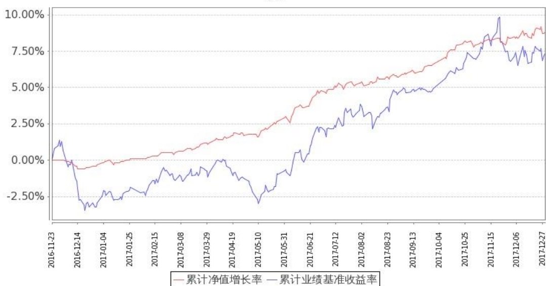
图：嘉实主题增强混合基金份额累计净值增长率与同期业绩比较基准收益率的历史走势对比图