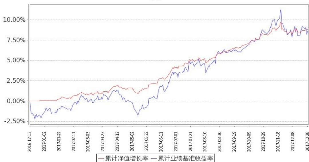
图：嘉实价值增强混合基金份额累计净值增长率与同期业绩比较基准收益率的历史走势对比图 (2016 年 12 月 13 日至 2017 年 12 月 31 日)

注：按基金合同和招募说明书的约定，本基金自基金合同生效日起 6 个月内为建仓期，建仓期结束时本基金的各项投资比例符合基金合同（十二（二）投资范围和（四）投资限制）的有关约定。