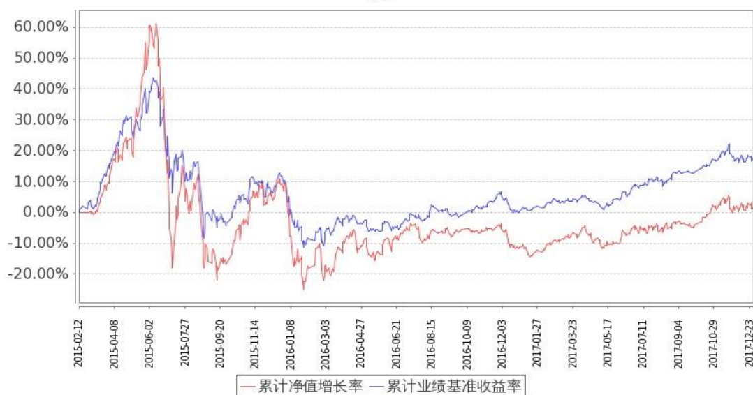
图：嘉实企业变革股票基金份额累计净值增长率与同期业绩比较基准收益率的历史走势对比图