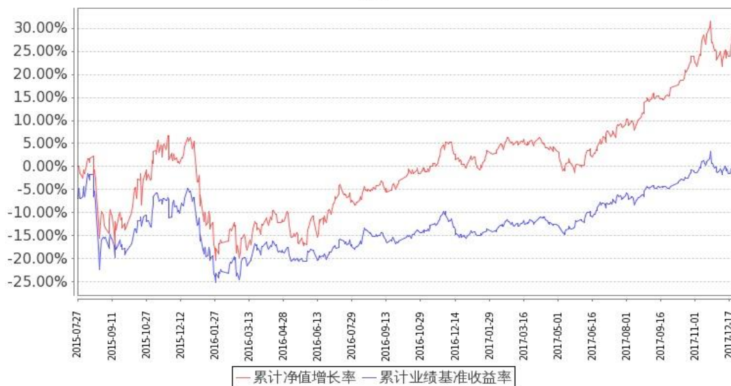
图：嘉实低价策略股票基金份额累计净值增长率与同期业绩比较基准收益率的历史走势对比图 (2015 年 7 月 27 日至 2017 年 12 月 31 日)

注：按基金合同和招募说明书的约定，本基金自基金合同生效日起 6 个月内为建仓期，建仓期结束时本基金的各项投资比例符合基金合同（十二（二）投资范围和（四）投资限制）的有关约定。