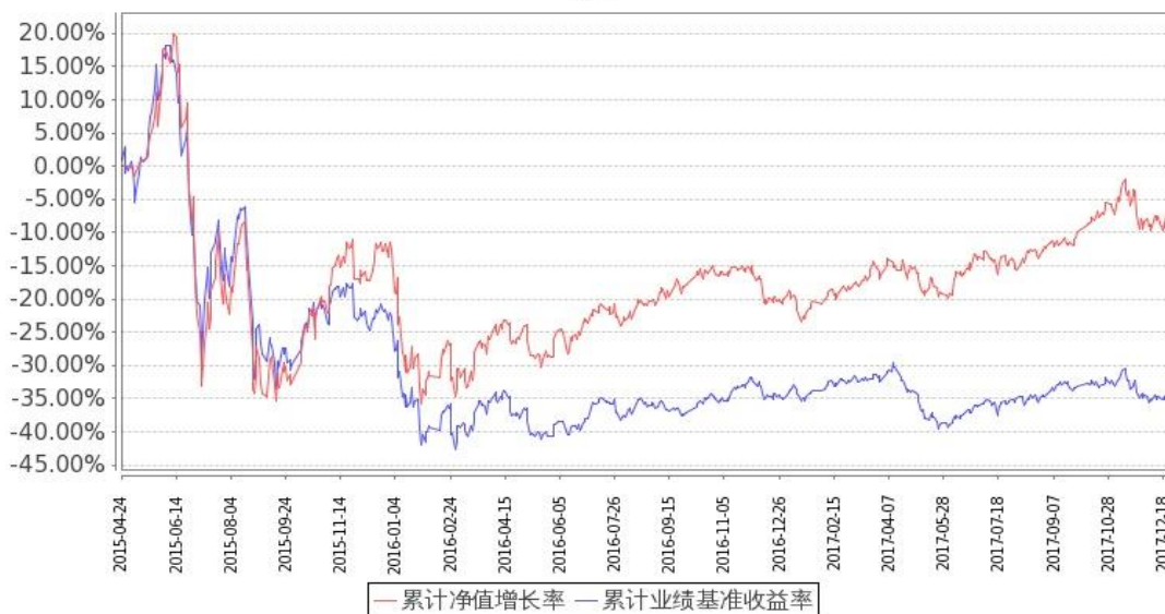
图：嘉实先进制造股票基金份额累计净值增长率与同期业绩比较基准收益率的历史走势对比图 (2015 年 4 月 24 日至 2017 年 12 月 31 日)

注：按基金合同和招募说明书的约定，本基金自基金合同生效日起 6 个月内为建仓期，建仓期结束时本基金的各项投资比例符合基金合同（十二（二）投资范围和（四）投资限制）的有关约定。