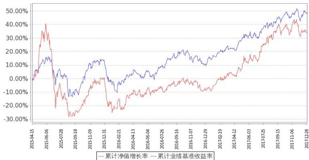
图 2：嘉实全球互联网股票-美元基金份额累计净值增长率与同期业绩比较基准收益率的历史走势对比图 (2015 年 4 月 15 日至 2017 年 12 月 31 日)

注：1. 按基金合同和招募说明书的约定，本基金自基金合同生效日起 6 个月内为建仓期，建仓期结束时本基金的各项投资比例符合基金合同（十二（二）投资范围和（六）投资限制）的有关约定。