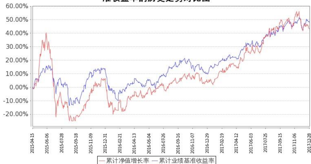
图 1：嘉实全球互联网股票-人民币基金份额累计净值增长率与同期业绩比较基准收益率的历史走势对比图