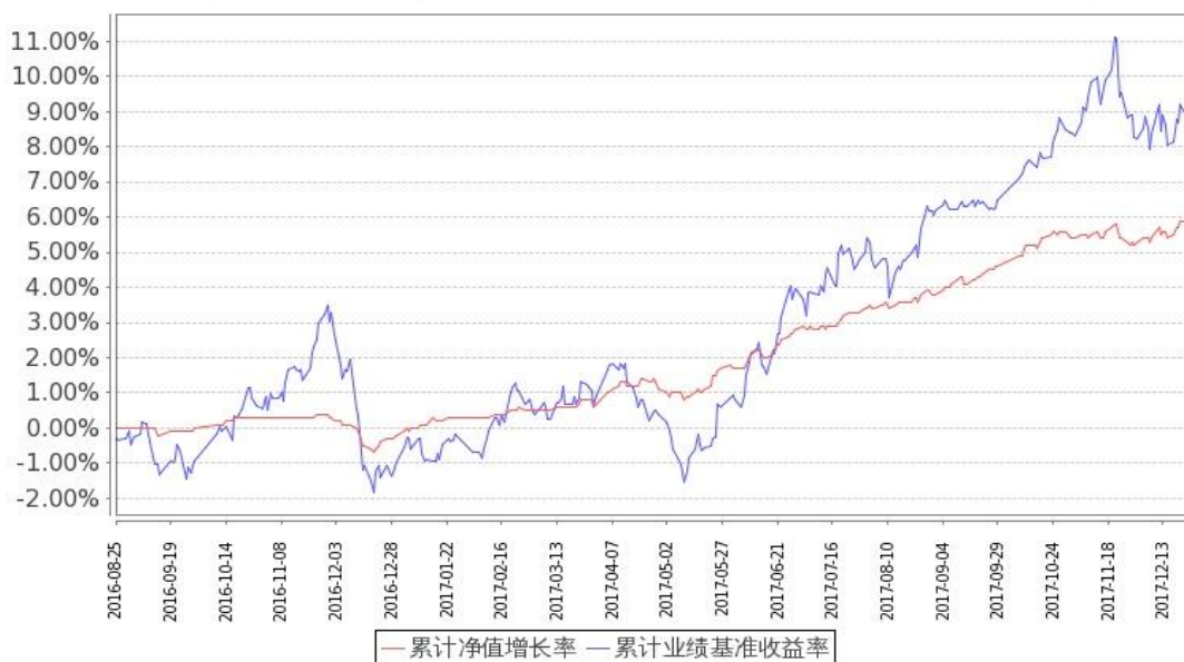
图：嘉实安益混合份额累计净值增长率与同期业绩比较基准收益率的历史走势对比图