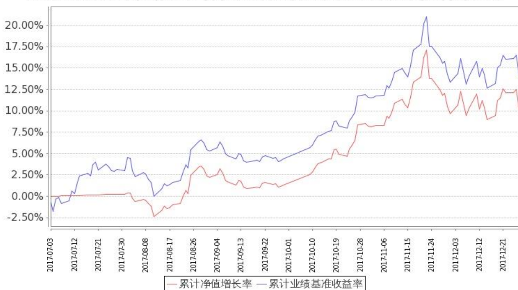
图：嘉实富时中国 A50ETF 基金份额累计净值增长率与同期业绩比较基准收益率的历史走势对比图 (2017 年 7 月 3 日至 2017 年 12 月 31 日)

注：本基金基金合同生效日 2017 年 7 月 3 日至报告期末未满 1 年。按基金合同和招募说明书的约定，本基金自基金合同生效日起 6 个月内为建仓期，本报告期处于建仓期内。