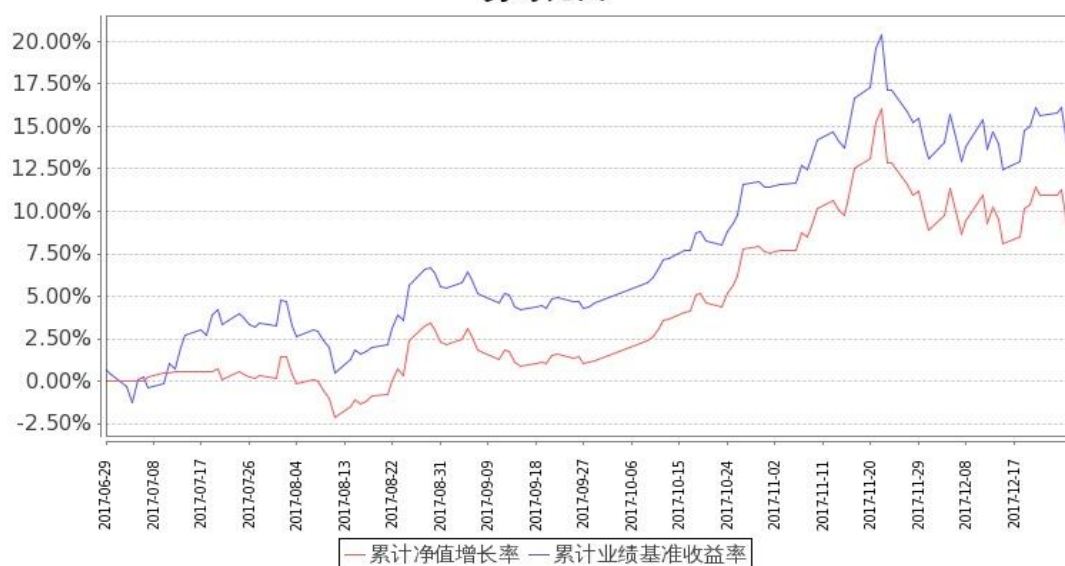
图：嘉实富时中国 A50ETF 联接基金份额累计净值增长率与同期业绩比较基准收益率的历史走势对比图

嘉实富时中国 A50ETF 联接累计净值增长率与同期业绩比较基准收益率的历史走势对比图