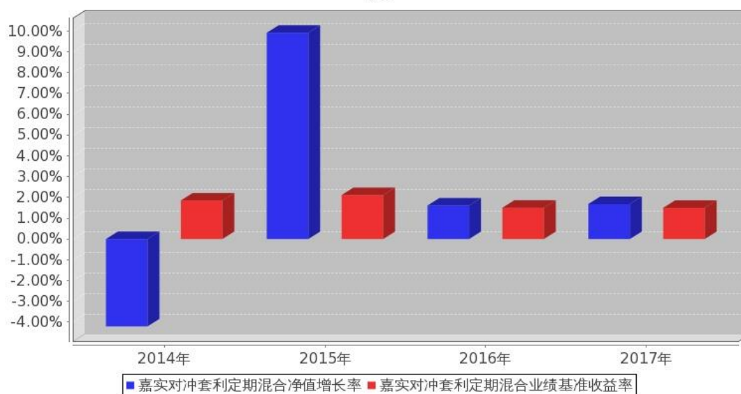
嘉实对冲套利定期混合基金每年净值增长率与同期业绩比较基准收益率的对比图

注：本基金基金合同生效日为 2014 年 5 月 16 日，2014 年度的相关数据根据当年实际存续期（2014 年 5 月 16 日至 2014 年 12 月 31 日）计算。