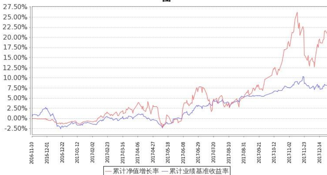
图：嘉实成长增强混合基金份额累计净值增长率与同期业绩比较基准收益率的历史走势对比图 (2016 年 11 月 10 日至 2017 年 12 月 31 日)

注：按基金合同和招募说明书的约定，本基金自基金合同生效日起 6 个月内为建仓期，建仓期结束时本基金的各项投资比例符合基金合同（十二（二）投资范围和（四）投资限制）的有关约定。