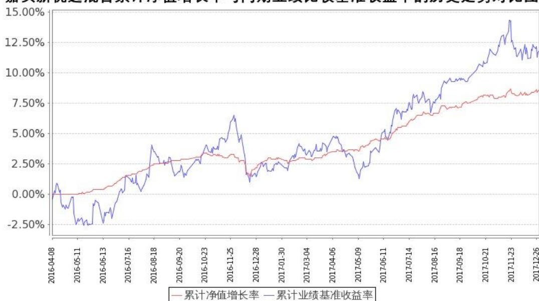
图：嘉实新优选混合基金份额累计净值增长率与同期业绩比较基准收益率的历史走势对比图