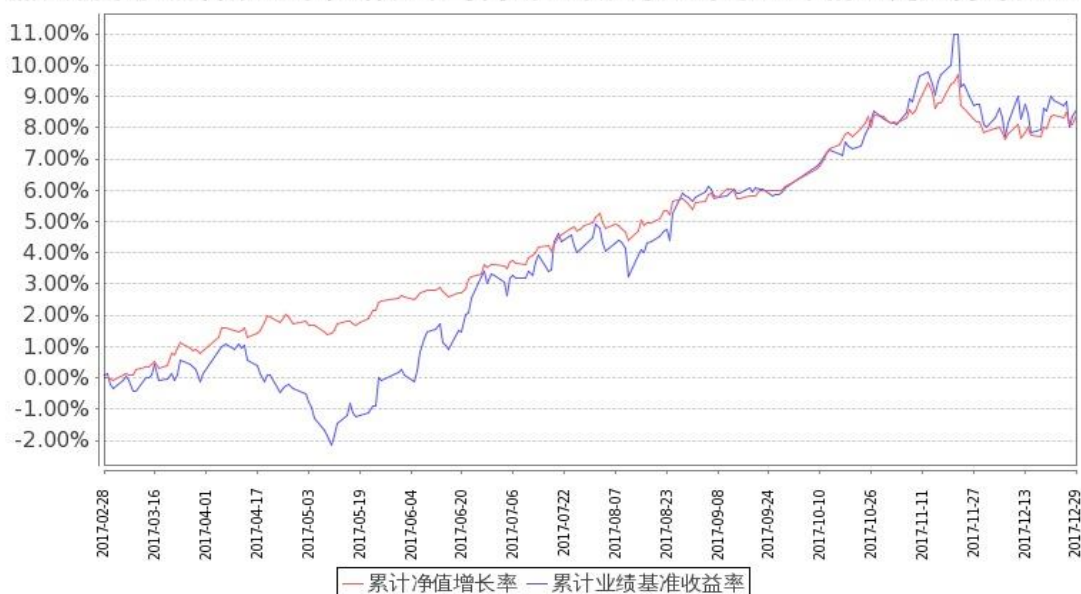
图：嘉实新添程混合基金份额累计净值增长率与同期业绩比较基准收益率的历史走势对比图 (2017 年 2 月 28 日至 2017 年 12 月 31 日)