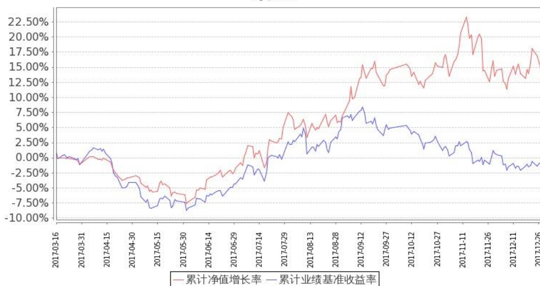
图 1：嘉实新能源新材料股票 A 基金累计份额净值增长率与同期业绩比较基准收益率的历史走势对比图