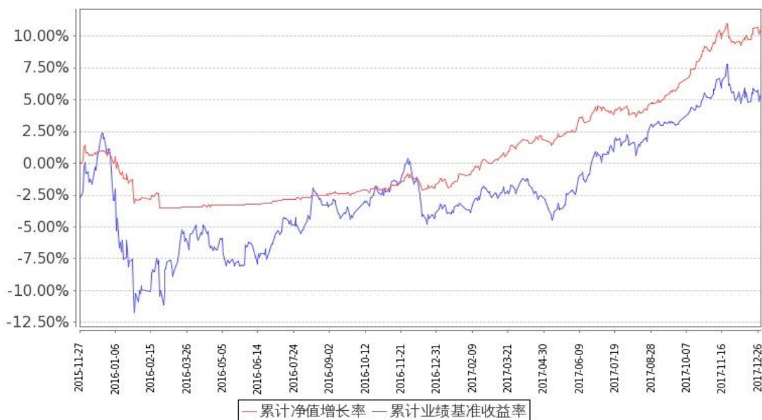
图 1：嘉实新起点混合 A 基金份额累计净值增长率与同期业绩比较基准收益率的历史走势对比图 (2015 年 11 月 27 日至 2017 年 12 月 31 日)