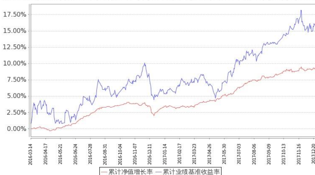
图：嘉实新起航混合基金份额累计净值增长率与同期业绩比较基准收益率的历史走势对比图