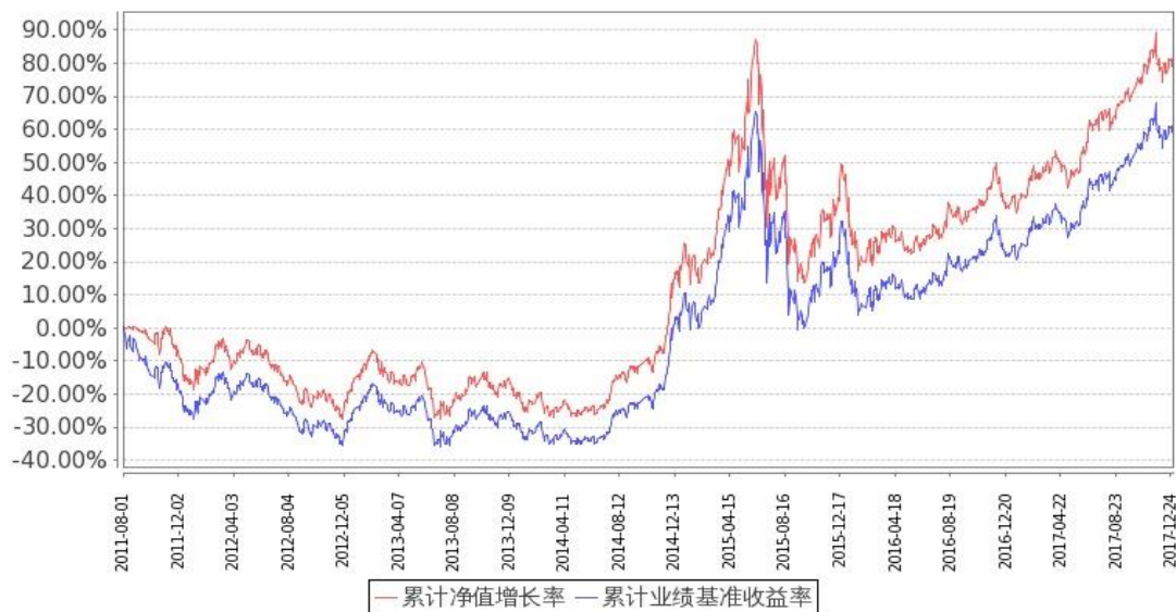
图：嘉实深证基本面 120ETF 联接基金份额累计净值增长率与同期业绩比较基准收益率的