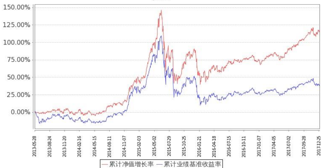
图：嘉实研究阿尔法股票基金份额累计净值增长率与同期业绩比较基准收益率的历史走势对比图 (2013年5月28日至2017年12月31日)

注：1. 按基金合同和招募说明书的约定，本基金自基金合同生效日起6个月内为建仓期，建仓期结束时本基金的各项投资比例符合基金合同“第十二部分（二）投资范围和（四）投资限制”的有关约定。