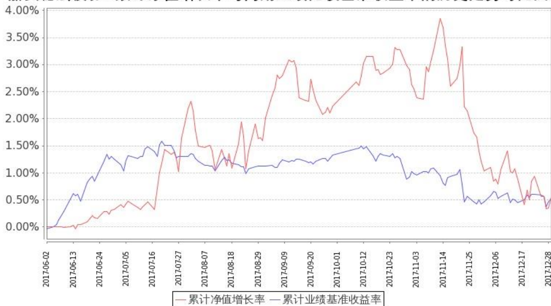
图 2：嘉实稳宏债券 C 基金份额累计净值增长率与同期业绩比较基准收益率的历史走势对比图