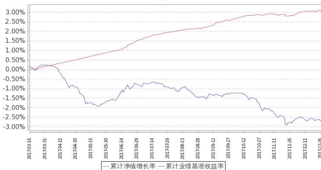
图：嘉实稳熙纯债债券基金份额累计净值增长率与同期业绩比较基准收益率的历史走势对比图 (2017年3月16日至2017年12月31日)

注：1. 本基金基金合同生效日 2017 年 3 月 16 日至报告期末未满 1 年。按基金合同和招募说明书的约定，本基金自基金合同生效日起 6 个月内为建仓期，建仓期结束时本基金的各项投资比例符合基金合同（十二（二）投资范围和（四）投资限制）的有关约定。