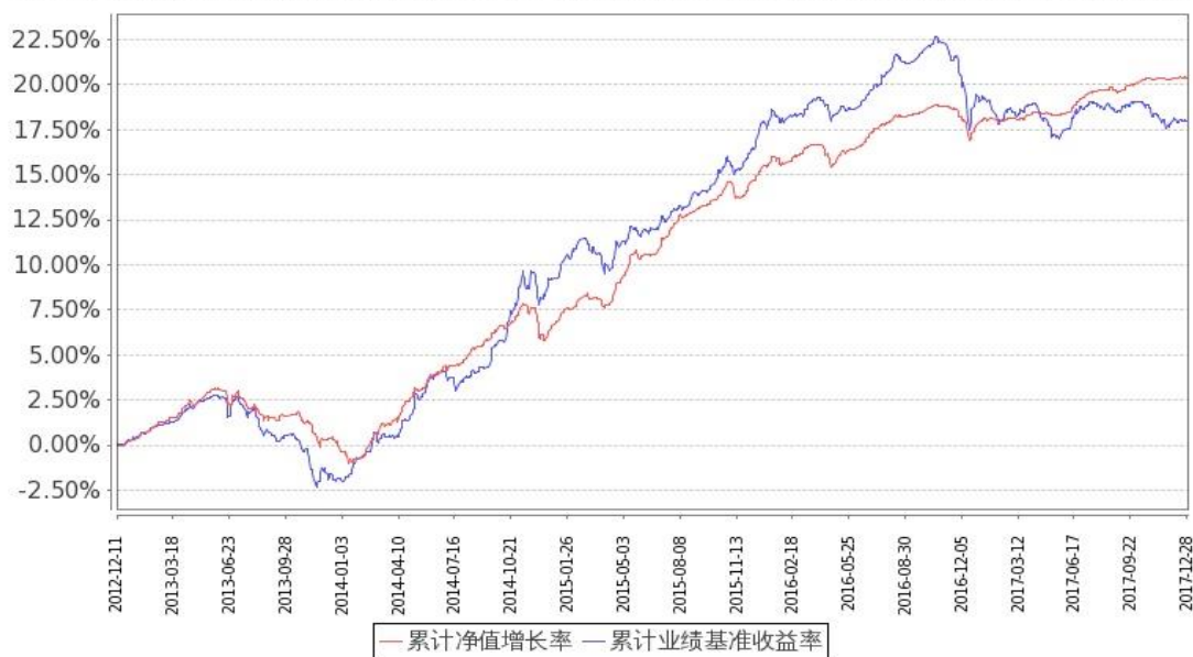
图 1：嘉实纯债债券 A 基金份额累计净值增长率与同期业绩比较基准收益率的历史走势对比图