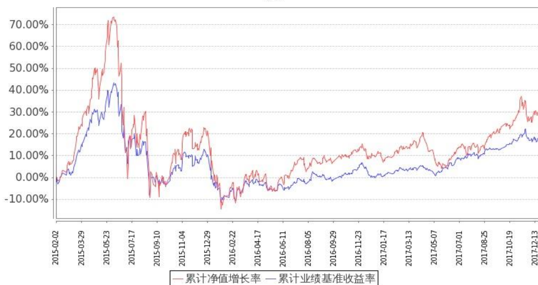
图：嘉实逆向策略股票基金份额累计净值增长率与同期业绩比较基准收益率的历史走势对比图 (2015年2月2日至2017年12月31日)

注：按基金合同和招募说明书的约定，本基金自基金合同生效日起6个月内为建仓期，建仓期结束时本基金的各项投资比例符合基金合同（十二（二）投资范围和（四）投资限制）的有关约定。