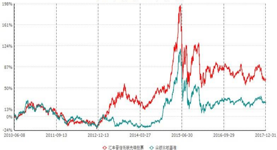
汇丰晋信低碳先锋股票型证券投资基金累计净值增长率与业绩比较基准收益率历史走势对比图 (2010年06月08日-2017年12月31日)

注：1. 按照基金合同的约定，本基金的投资组合比例为：股票投资比例范围为基金资产的85%-95%，权证投资比例范围为基金资产净值的0%-3%。固定收益类证券、现金和其他资产投资比例范围为基金资产的5%-15%，其中现金或到期日在一年以内的政府债券的投资比例不低于基金资产净值的5%。本基金自基金合同生效日起不超过六个月内完成建仓。截止2010年12月8日，本基金的各项投资比例已达到基金合同约定的比例。