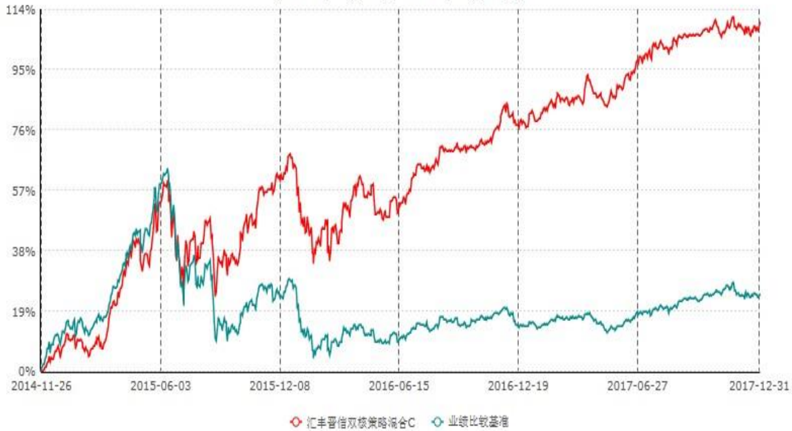
汇丰晋信双核策略混合C累计净值增长率与业绩比较基准收益率历史走势对比图 (2014年11月26日-2017年12月31日)